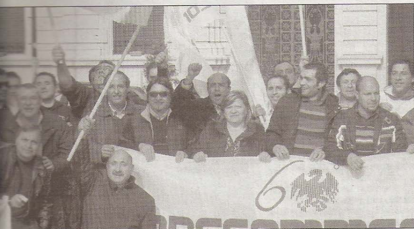
momento della protesta di due giorni fa in piazza Italia

amente la zona tra via Cardinale Ruffolo e piazzale delle Erbe